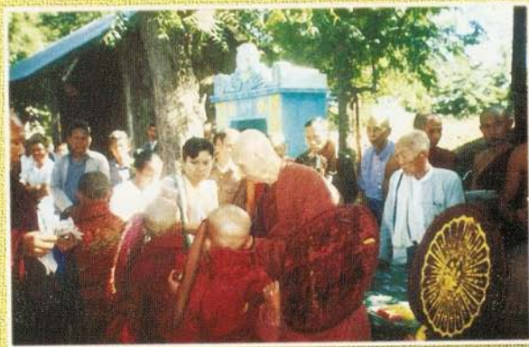
၈၃ နှစ်မြောက်မွေးနေ့တွင် မြေရင်းတောရ ဏရာတော်ဘုရားကြီး သာမဏေများအားလှူနေစဉ်