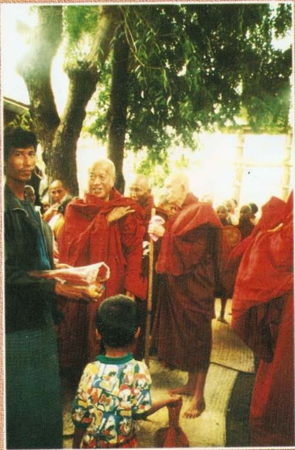
၁၃၆၄ ခု မြေရင်းတောရုဏရာတော် (၇၂) နှစ်မွေးနေ့တွင် လှူဒါန်းနေစဉ်