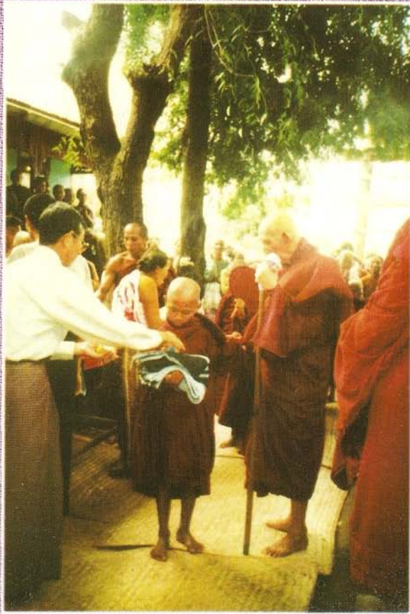
မြေဇင်းတောရဟန်းတော်ဘုရားကြီး (၈၃) နှစ်မြောက်မွေးနေ့တွင် သာမဏေများအားလှူဒါန်းနေစဉ်

ဘယ်အသီးကို ဆွတ်ခူးခူး နိဗ္ဗာန်ကိုပဲ ဆုတောင်းပြီး ဆွတ်ခူးကြ။