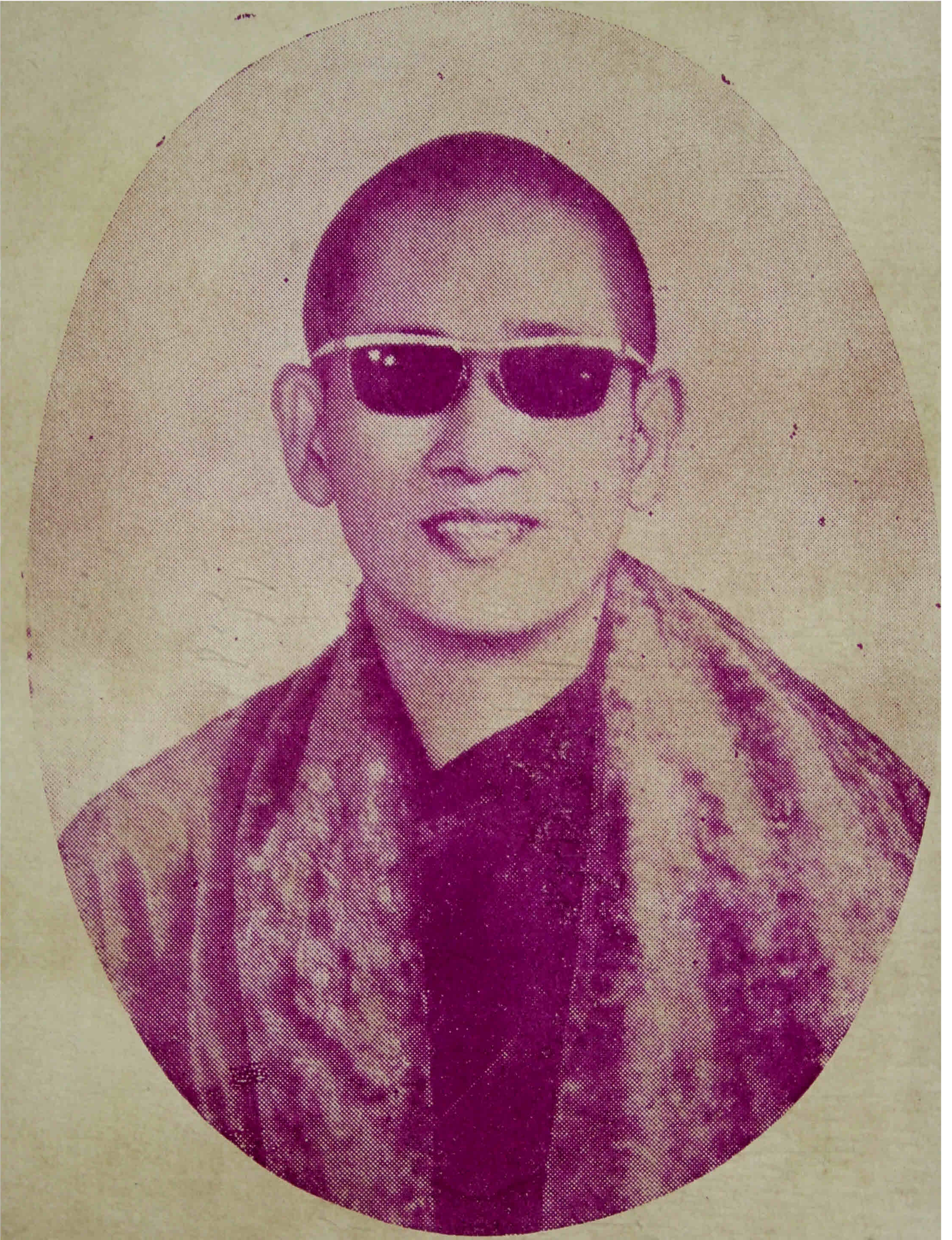
ဓမ္မကထိက ဦးကျသလ ပုံတော်