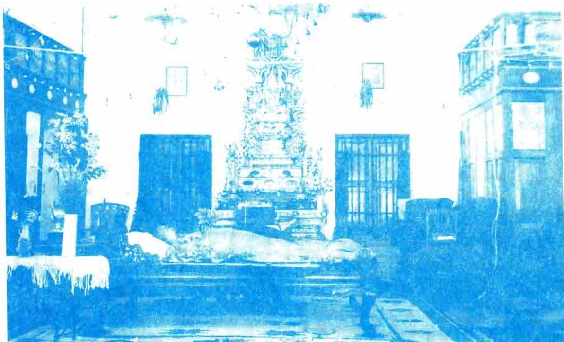
၁၃၁၄ ခုနှစ်၊ ကဆုန်လပြည့်ကျော် (၉) ရက်၊ စနေနေ့ ညနေ ၄ နာရီ ၅၅ မိနစ်အချိန်တွင် ပရိနိဗ္ဗာန်ပြုတော်မူသော သွန်သွန်၊ သရားတော်မူရာ ခြံ ရွှပ်ကလပ်တော်။