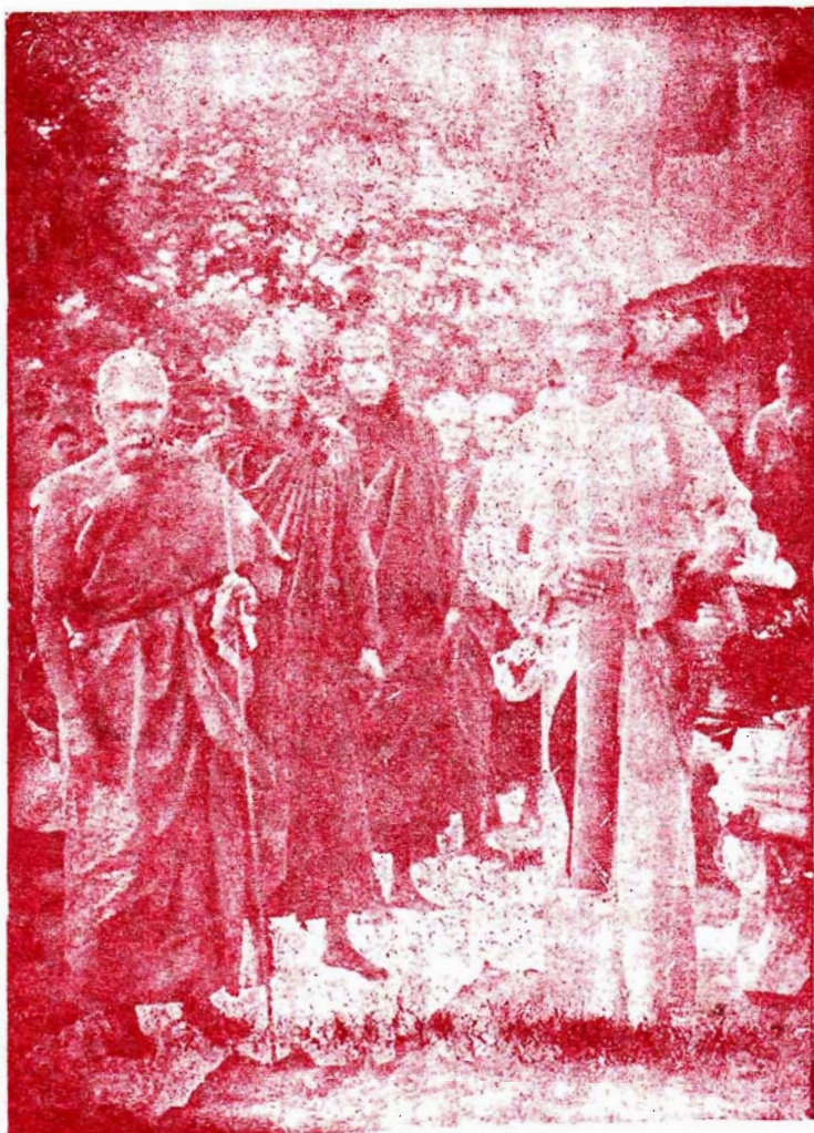
၁၃၁၀-ခုနှစ် ကံထပ်ပြီး သိမ်အထွက်ရိုက်တူးထားသောပုံတော်။