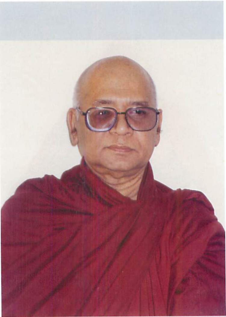
ဆန်းလွင် (ရှင်အာဒိစ္စရံသီ)