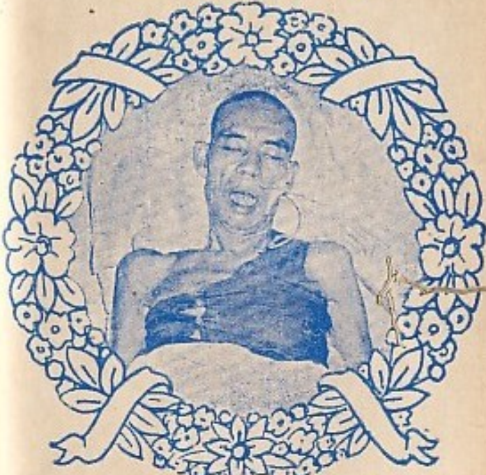
ထွက်လေ ဝင်လေ ချုပ်ခါနီး အချိန်တွင် မိမိ စိတ်ကြိုက် ထူရိယာပုတ်ဖြင့် မနေနိုင်တော့ပါပြီ။ ထွက်လေ ဝင်လေကိုမူကား မှန်မှန် ရှုနေပါသည်။ ရံဖန်ရံခါ ပါးဝင်ကို ကသုံးပြုပါသည်။ (တရားဆိုင်ငင် ထူရိယာပုတ် မပြင်ကြနဲ့၊ အဲဆင်းဂူ ဩဂါဒ)