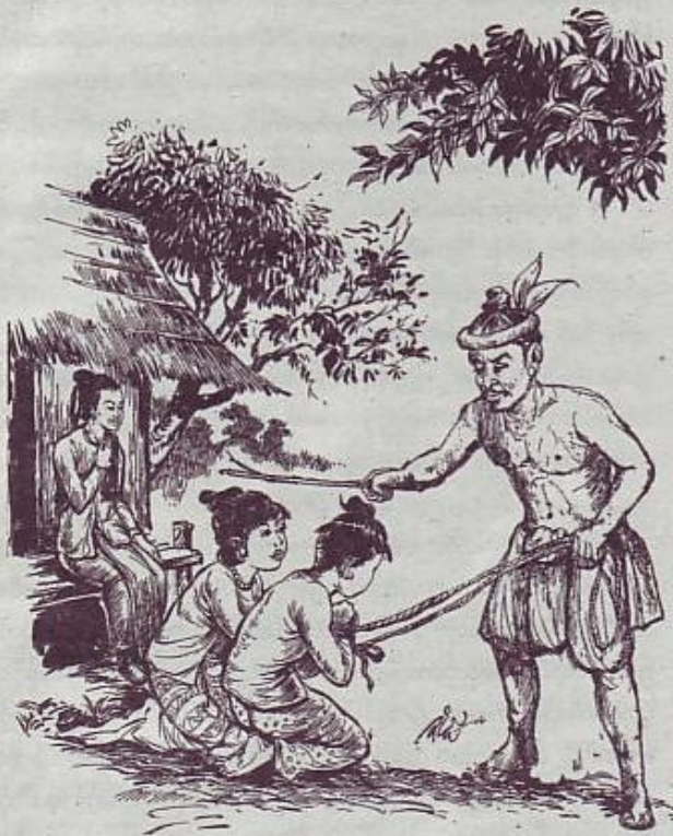
ဝေသန္တရာမင်းကြီးတင်တင် သမီးနဲ့ သားကို စုခကာပုလ္လုားတာ၊ လျှင်နိုးခေပုံ