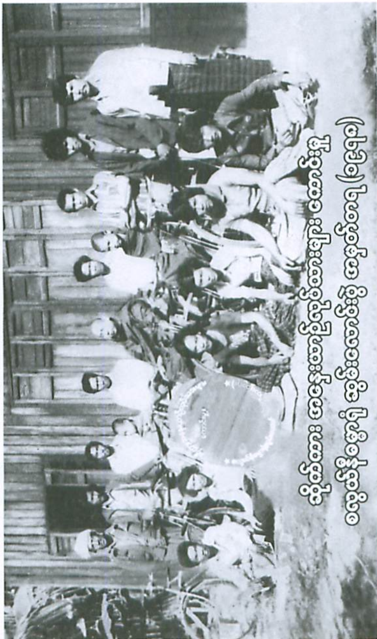
(၁၉၅၅) နေပြည်တော် မြို့နယ် အောက်ကျေးရွာ (၁၉၅၅) သို့မဟုတ် အခြား မြို့နယ်များရှိ နေထိုင်သူများ